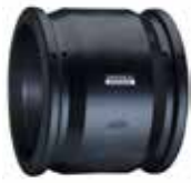
Acoples de electrofusión