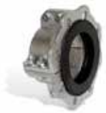
Acoples bridado GP