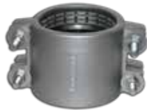
Conector mecánico doble